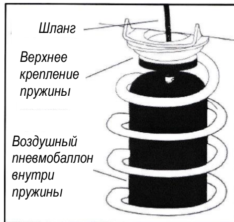
Рис. 2: Крепление пневмобаллона к пружине