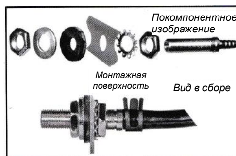
Рис. 3: Сборка клапана для накачивания

Примечание: Всегда поддерживайте давление воздуха в пневмобаллонах (Air Springs) не менее 5 фунтов на кв. дюйм (35 кПа = 0,35 бар), чтобы предотвратить истирание. При погрузке рекомендуется увеличить также давление в шинах пропорционально перевозимому грузу.